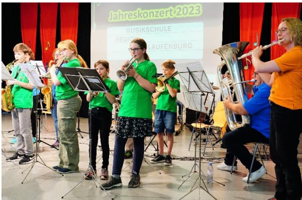
Foto 7: Die Beginners- und Jugend Band mit Verstärkung von Erwachsenen

Vier Blockflötenschülerinnen trugen «If you're happy» und weitere beschwingte Stücke vor. Das Publikum dankte mit einem langanhaltenden Beifall.